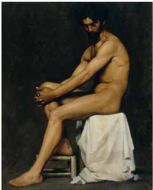
ALBERT EDELFEIT Istuva mies (akatemiaharjoitelma) 1875

Näyttääkö mun hauis liian ohuelta tässä?